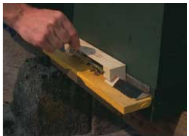
Breng tijdens de bijenvlucht iedere twee uur stuifmeel aan in de BeeBoosters.

Bij appel komt bacterievuur nauwelijks voor. Als er aantasting bij appel optreedt gaat dit voornamelijk via scheutinfectie. Daarbij spelen de bijen geen rol.