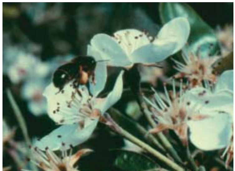
Honingbij op perenbloem, de nectar van deze bloemen bevat slechts 10 tot 20% suikers, bij appel is dat ongeveer 45%. Perenbloemen leveren wel veel stuifmeel.

Parthenocarpie is vruchtzetting zonder zaadzetting. De vorm van de vruchten laat dan vaak te wensen over. Het is niet duidelijk of bestuiving in zeer geringe mate nodig is als prikkel voor zaadloze vruchtzetting. Parthenocarpie komt bij peren regelmatig voor, vooral bij het ras 'Conference'.