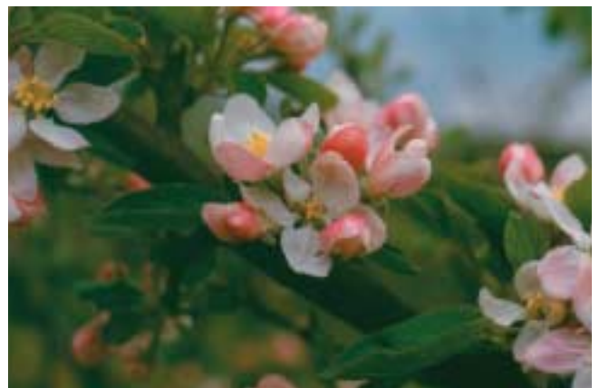
Appelbloemen zijn ingericht om bestuivende insecten te lokken.

Stuifmeel wordt gevormd in de helmknoppen van de meeldraden. Als de helmknoppen rijp zijn komt het stuifmeel vrij. Bestuiving is het overbrengen van stuifmeel van de meeldraden naar het kleverige stempeloppervlak van de stamper. Voordat de bevruchting plaats kan vinden moet de pollenbuis, die uit de stuifmeelkorrel groeit, door de stijl van de stamper naar het vruchtbeginsel groeien. Uit de stuifmeelbuis komen 2 mannelijke geslachtscelkernen; één versmelt met de eicel tot het embryo of de kiem. De tweede celkern versmelt met 2 poolkernen tot het endosperm dat het reservevoedsel vormt in het zaad. Het gehele vruchtbeginsel groeit uit tot vrucht.