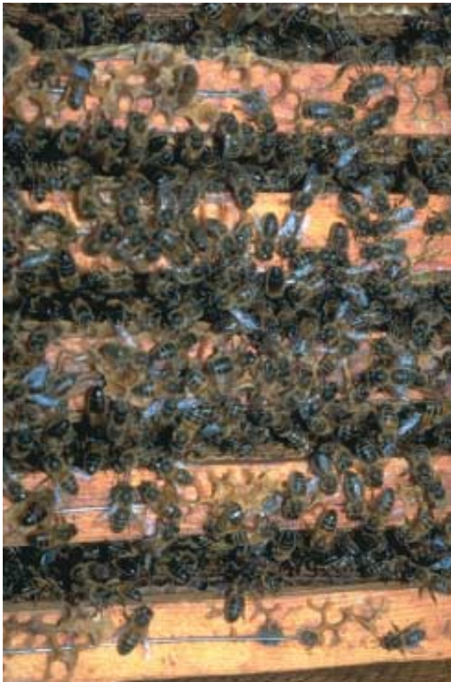
Doordat bijen in de kasten zeer dicht bij elkaar zitten vindt daar ook uitwisseling van stuifmeel plaats, wat bijdraagt aan kruisbestuiving.

Bij hommels overwintert alleen de koningin. Tijdens de fruitbloei zijn er van nature alleen hommels-koninginnen actief. Ze beginnen dan met de opbouw van een nieuwe hommelskolonie. Hommels hebben het voordeel dat ze al bij 8°C actief zijn. Bijen zijn dit vanaf 10°C. Hommelsvolken bevatten maximaal enkele honderden hommels.